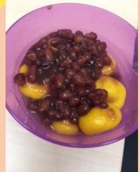
中学生グループ作 かぼちゃのお月見団子

さすが中高生のお兄さんお姉さんチームでとてもきれいな色のカボチャ団子が出来上がりました♪