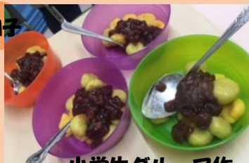
小学生グループ作 かぼちゃのお月見団子

お芋チップスチームはお芋をスライサーで薄くする作業に苦戦！ かぼちゃチームはかぼちゃをつぶす作業に苦戦！ どちらも大変な工程を乗り越えて美味しいお菓子が完成しました♪