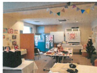
展示会 会場『ぶちぶらす』